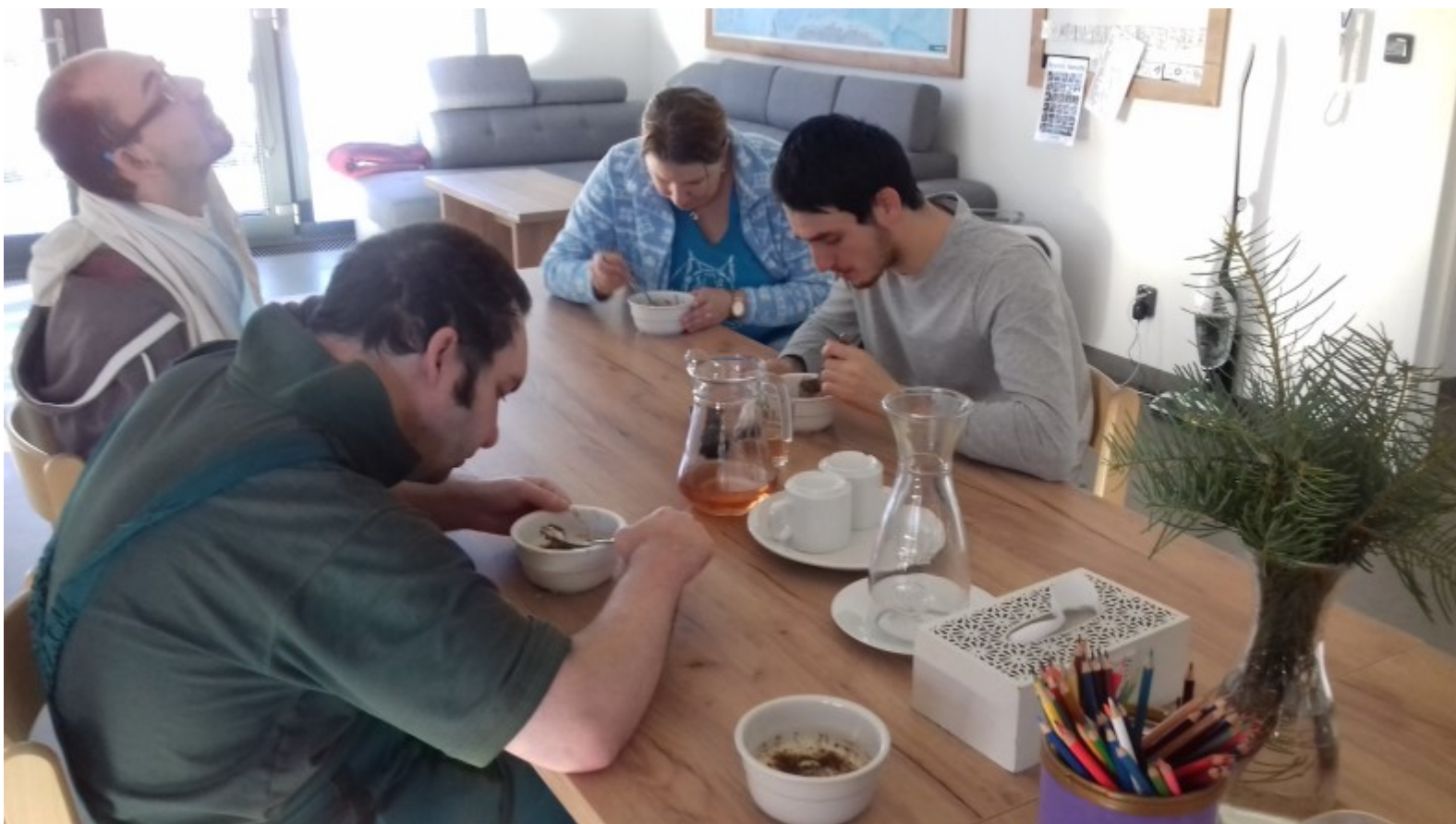
Pár momentek z našich dílniček