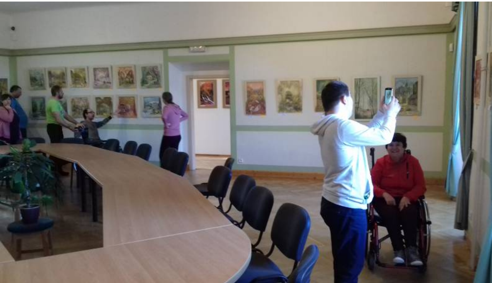
A potom jsme vyjeli do 1.patru, kde se nachází muzeum zaměřené na historii zámku a obce Žihobce